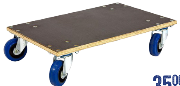
PLANCHE A ROULETTES